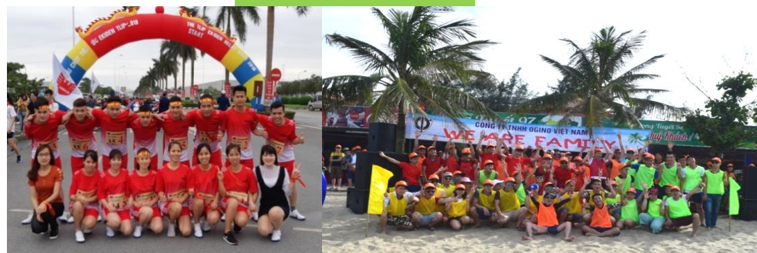
Hoạt động văn hóa thể thao